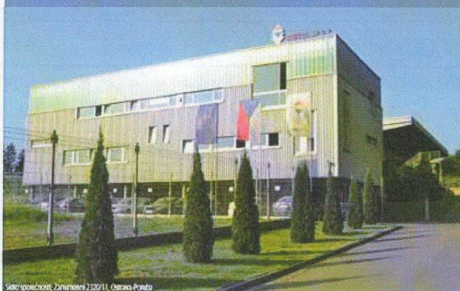
Sídlo společnosti, Zahradní 2320/11, Ostrava-Poruba

Kvalitní vybavení a technické zázemí společnosti LIFTCOMP a.s.