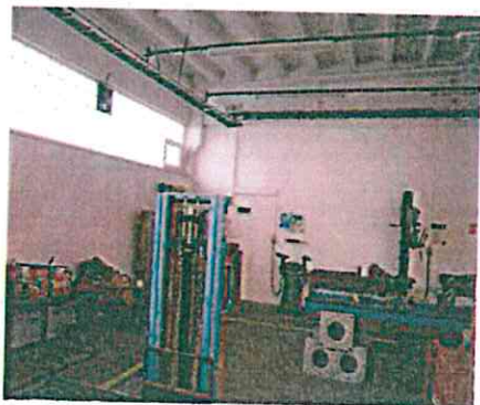
Pohled z venku